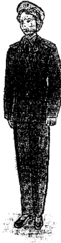
Ամենօրյա ամառային համազգեստ՝ կին քրեակատարողական ծառայողների համար