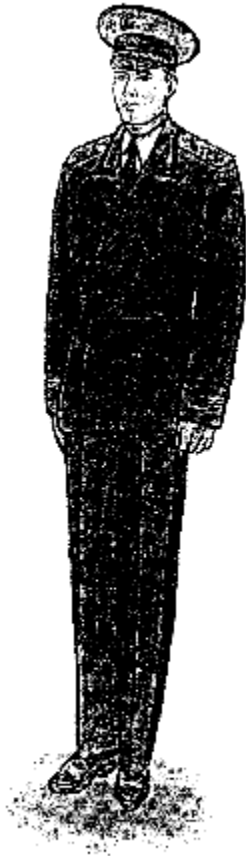
Տոնական ամառային համազգեստ գեներալների համար

7.1. Սույն բաժնում տրվում են արդարադատության գեներալ-մայորի, արդարադատության գնդապետից մինչև արդարադատության լեյտենանտի, արդարադատության ավագ ենթասպայից մինչև արդարադատության կրտսեր սերժանտի կոչում ունեցող քրեակատարողական ծառայողների և կին քրեակատարողական ծառայողների համազգեստի նկարները: