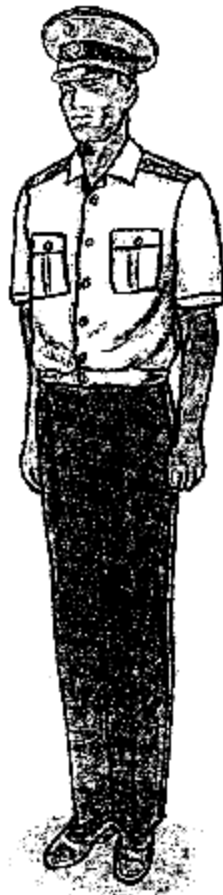
Ամենօրյա (սպիտակ կարճաթև վերնաշապիկով) ամառային համազգեստ՝ արդարադատության գեղապետից մինչև արդարադատության լեյտենանտի կոչում ունեցող քրեակատարողական ծառայողների համար