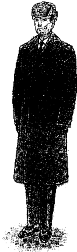
Տոնական ծմբային համազգեստ՝ զեներալների համար