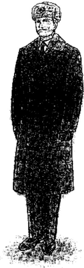
Տոնական ձմեռային համազգեստ՝ արդարադատության գեղապետից մինչև արդարադատության լեյտենանտի կոչում ունեցող քրեակատարողական ծառայողների համար