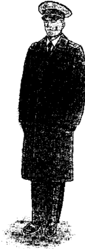
Ամենօրյա ծմբային համազգեստ՝ զեներալների համար