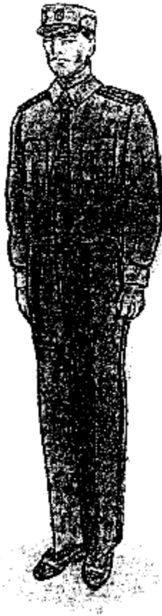
Ամենօրյա ամառային համազգեստ (մուգ խակի գույնի երկարաթև վերնաշապիկով)՝ արդարադատության ավագ ենթասպայից մինչև արդարադատության կրտսեր սերժանտի կոչում ունեցող քրեակատարողական ծառայողների համար