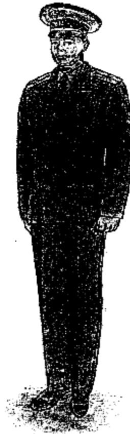
Ամենօրյա ամառային համազգեստ՝ արդարադատության գեղապետից մինչև արդարադատության լեյտենանտի կոչում ունեցող քրեակատարողական ծառայողների համար