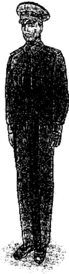
Ամենօրյա ամառային համազգեստ՝ (երկարաթև մուգ խակի գույնի վերնաշապիկով)՝ արդարադատության գնդապետից մինչև արդարադատության լեյտենանտի կոչում ունեցող քրեակատարողական ծառայողների համար