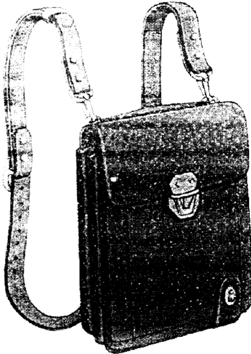
Քրեակատարողական ծառայողի դաշտային պայուսակ