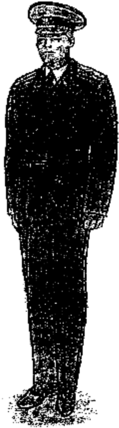
Տոնական ամառային համազգեստ՝ արդարադատության գեղապետից մինչև արդարադատության լեյտենանտի կոչում ունեցող քրեակատարողական ծառայողների համար