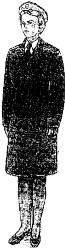
Տոնական ամառային համազգեստ՝ կին քրեակատարողական ծառայողների համար