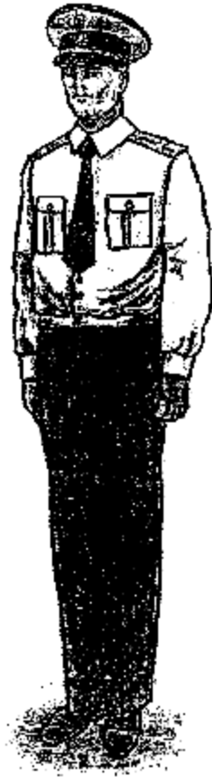
Տոնական (սպիտակ երկարաթև վերնաշապիկով) ամառային համազգեստ՝ արդարադատության գեղապետից մինչև արդարադատության լեյտենանտի կոչում ունեցող քրեակատարողական ծառայողների համար