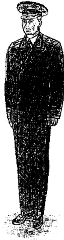
Ամենօրյա ամառային համազգեստ՝ գեներալների համար