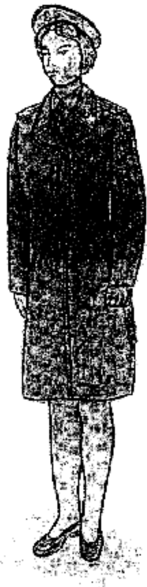
Տոնական ձմեռային համազգեստ՝ կին քրեակատարողական ծառայողների համար