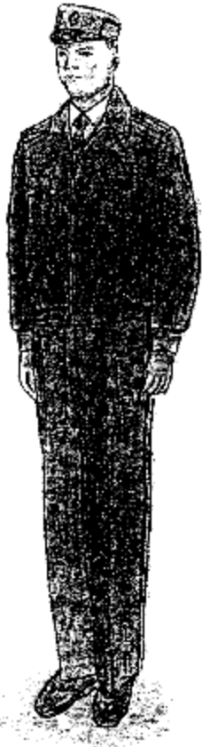
Տոնական ամառային համազգեստ՝ արդարադատության ավագ ենթասպայից մինչև արդարադատության կրտսեր սերժանտի կոչում ունեցող քրեակատարողական ծառայողների համար