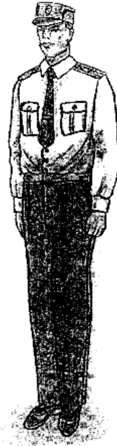
Տոնական ամառային համազգեստ (սպիտակ երկարաթև վերնաշապիկով)՝ արդարադատության ավագ ենթասպայից մինչև արդարադատության կրտսեր սերժանտի կոչում ունեցող քրեակատարողական ծառայողներ համար