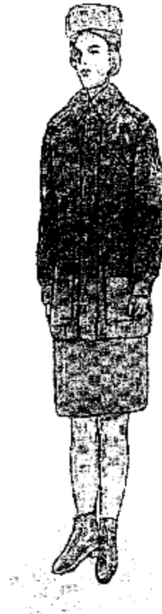
Ամենօրյա ձմեռային համազգեստ՝ կին քրեակատարողական ծառայողների համար