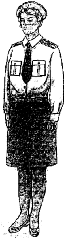
Տոնական ամառային համազգեստ (սպիտակ երկարաթև վերնաշապիկով)՝ կին քրեակատարողական ծառայողների համար