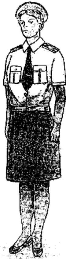
Տոնական ամառային համազգեստ (սպիտակ կարճաթև վերնաշապիկով) կին քրեակատարողական ծառայողների համար