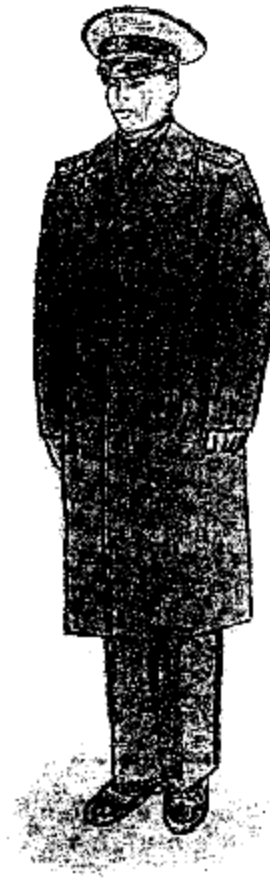
Ամենօրյա ձմեռային համազգեստ՝ արդարադատության գեղապետից մինչև արդարադատության լեյտենանտի կոչում ունեցող քրեակատարողական ծառայողների համար