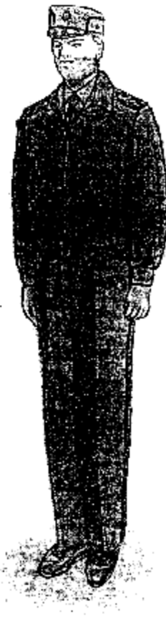
Ամենօրյա ամառային համազգեստ՝ արդարադատության ավագ ենթասպայից մինչև արդարադատության կրտսեր սերժանտի կոչում ունե ցրեակատարողական ծառայողների համար