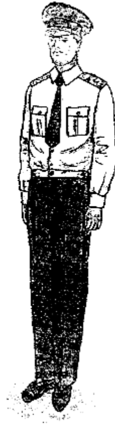
Տոնական ամառային (երկարաթև վերնաշապիկով) համազգեստ՝ գեներալների համար