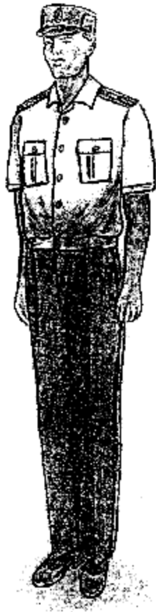
Տոնական ամառային համազգեստ (սպիտակ կարճաթև վերնաշապիկով) արդարադատության ավագ ենթասպայից մինչև արդարադատության կրտսեր սերժանտի կոչում ունեցող քրեակատարողական ծառայողների համար