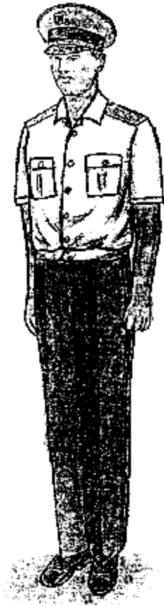
Տոնական ամառային (կարճաթև վերնաշապիկով) համազգեստ՝ գեներալների համար