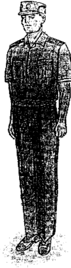
Ամենօրյա ամառային համազգեստ (մուգ խակի գույնի կարճաթև վերնաշապիկով արդարադատության ավագ ենթասպայից մին արդարադատության կրտսեր սերժանտի կոչո ունեցող քրեակատարողական ծառայողների հ