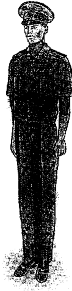
Ամենօրյա ամառային համազգեստ՝ (կարճաթև մուգ խակի գույնի վերնաշապիկով)՝ արդարադատության գնդապետից մինչև արդարադատության լեյտենանտի կոչում ունեցող քրեակատարողական ծառայողների համար